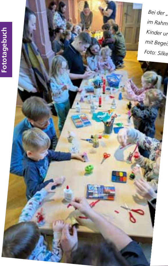
Bei der „Kirche für die Kleinen“ wurde im Rahmen des Gottesdienstes für Kinder und ihre Familien auch wieder mit Begeisterung gebastelt.