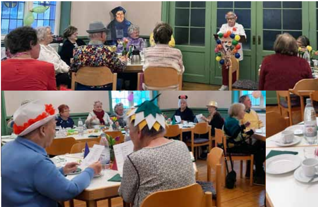
Der Gemeindenachmittag feiert im Evangelischen Gemeindehaus einen närrischen Gemeindenachmittag. Die ehrenamtlich Mitarbeitenden haben vorher mit viel Liebe die Tische vorbereitet.