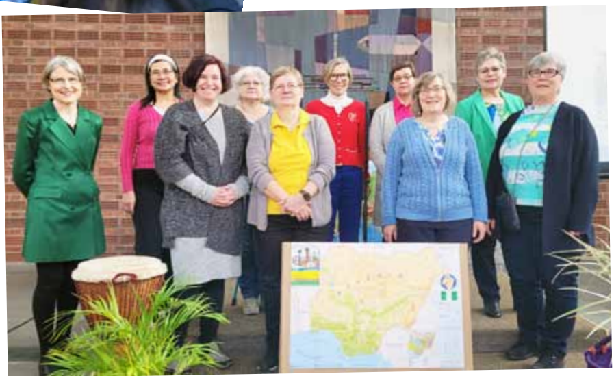
Die Frauen der Weltgebetstagsgruppe warten auf die Gemeinde, um einen bunten und spannenden Gottesdienst mit ihnen zu feiern.